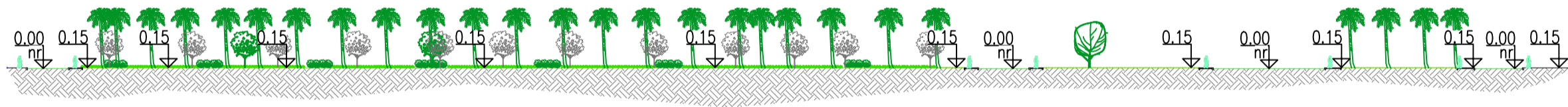
3 CORTE A' A' esc 1:700