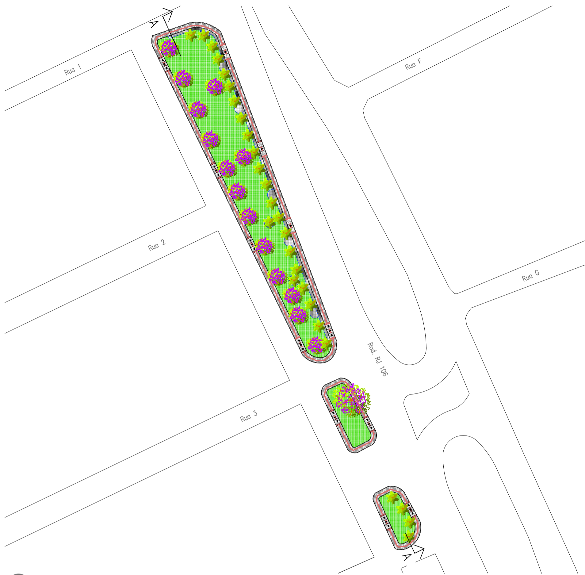
1 PROJETO BÁSICO CANTEIRO DO CANTEIRO LATERAL DO TUBARÃO - VISÃO GERAL esc 1:800