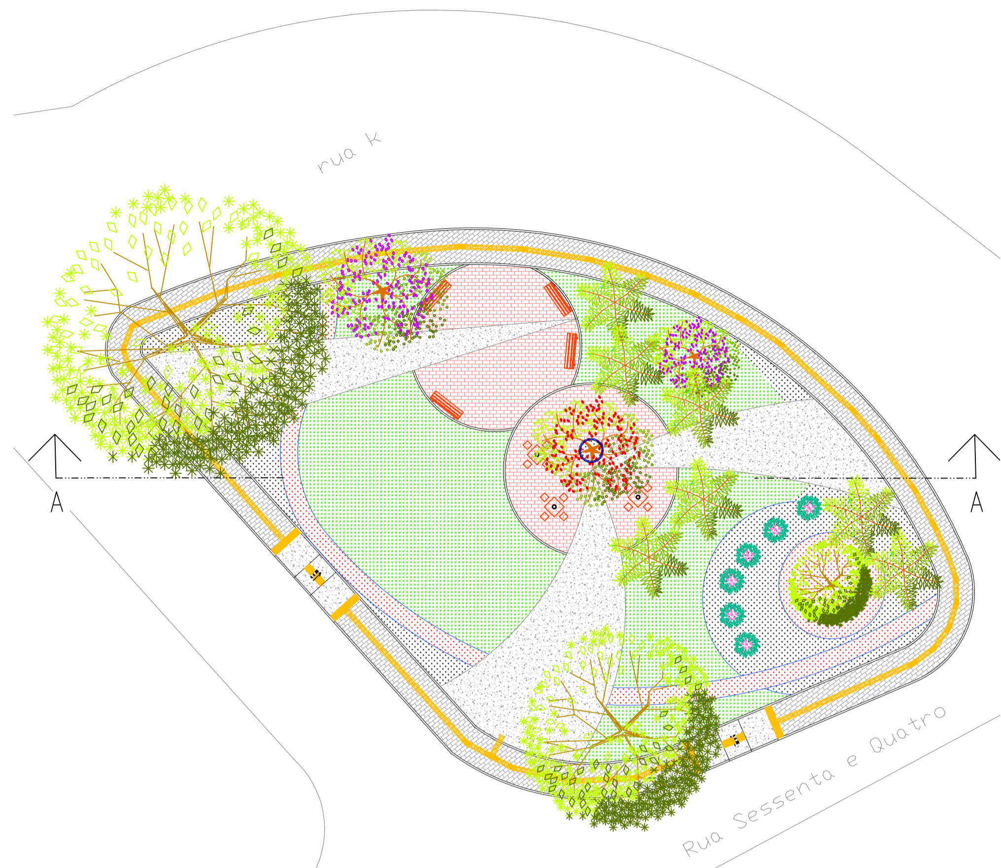
1 LARGO DO BOQUEIRÃO - VISÃO GERAL esc. 1:200